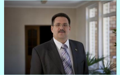
Дорогие друзья, читатели газеты «Время верить»!

Бог в Духе Святом дал нам все необходимое для победоносной жизни. У нас никогда не будет недостатка в божественном присутствии, потому что... (Продолжение на стр.2)