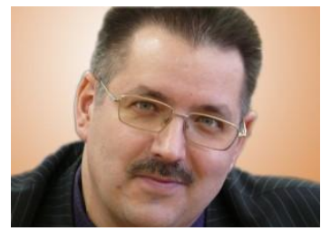
Дорогие друзья, читатели газеты «Время верить»!

г.Узловая, Гагарина, 18 (здание церкви) тел. 6-14-18